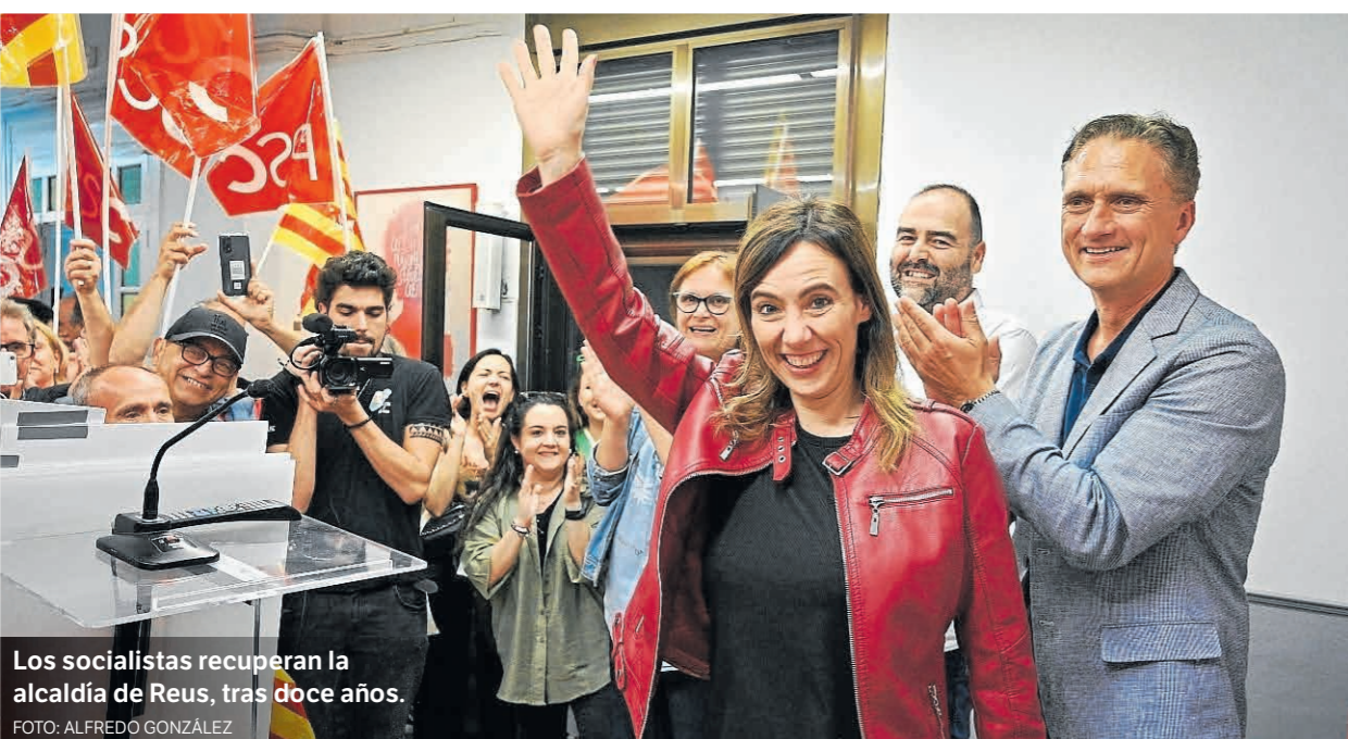
Los socialistas recuperan la alcaldía de Reus, tras doce años.